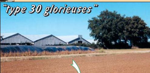
"type 30 glorieuses"