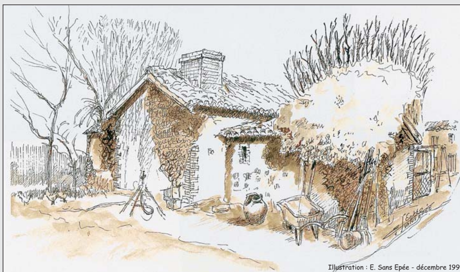
Illustration : E. Sans Epée - décembre 1999

Témoins du dynamisme des Mauges, les sièges d'exploitations agricoles véhiculent l'identité du territoire (culturelle et paysagère). Pour faire face à la tendance de banalisation des sièges, une amélioration paysagère personnalisée et respectueuse de l'identité locale vous est proposée.