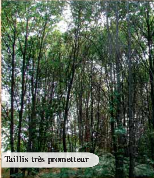
Taillis très prometteur

Le châtaignier est par excellence l'essence des taillis des Mauges, il recouvre plus du tiers des surfaces (1510 ha sur 4290 ha). L'impact paysager est d'autant plus fort que les boisements du territoire sont faibles (5%). La conduite en taillis autrefois pratiquée principalement pour l'approvisionnement en piquets (vigne, élevage) et quelques gros pieds pour la charpente, se perpétue aujourd'hui encore pour la production de bois de chauffage et de piquets (élevage, arboriculture, viticulture). Cependant, la gestion des taillis se fait souvent par à-coups (selon la demande ou le besoin) et par coupes rases. Ce mode de gestion, annule pour une part des taillis toutes valorisations plus fructueuses. Toutefois pour ceux-ci, il est possible d'améliorer sensiblement leur valeur marchande par un changement de pratiques, tout en renforçant leurs autres fonctions ; paysagère, cynégétique, récréative, biologique .