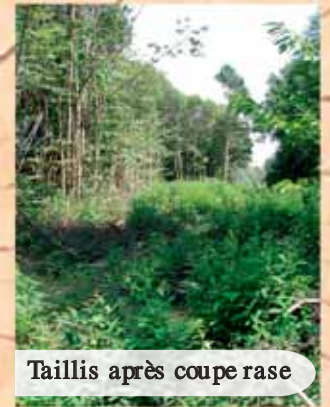
Taillis après coupe rase