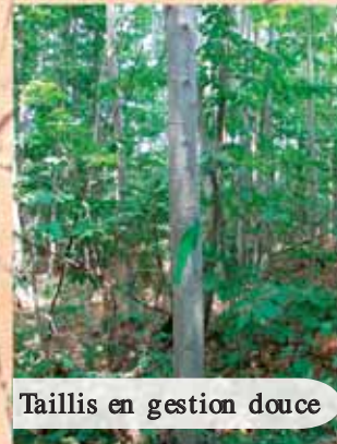
Taillis en gestion douce