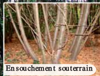
En souchement souterrain